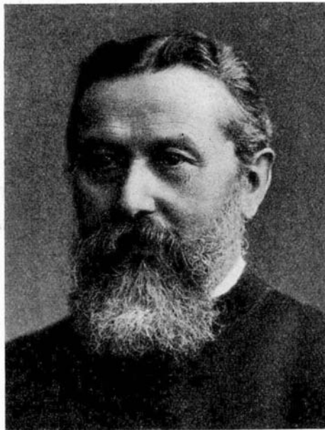
E. Benelius. Fotografi.

I Stockholm fanns sedan tidigare Sankta Eugenia katolska församling, som nu helt kom att domineras av jesuiterna. För Sverige hade man storstilade planer på att värva nya medlemmar; äntligen hade man med den gradvisa religionsfrihetens införande möjlighet att åter sprida den katolska lärans budskap på ett mer intensivt sätt. Därför behövde man även skapa ett högkvarter med kyrka som kunde bli samlingspunkten för jesuiternas kamp om att få svenskarna till det som de ansåg var den rätta tron.